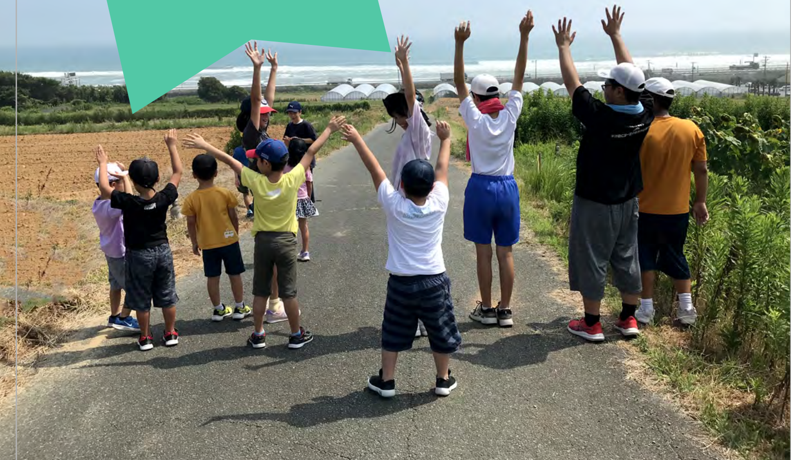
放課後等デイサービス屋外活動（8月静岡県湖西市）