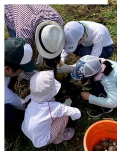
【じゃがいも掘り 6月28日】